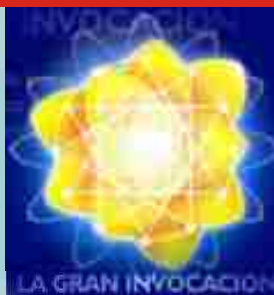
LA GRAN INVOCACIÓN